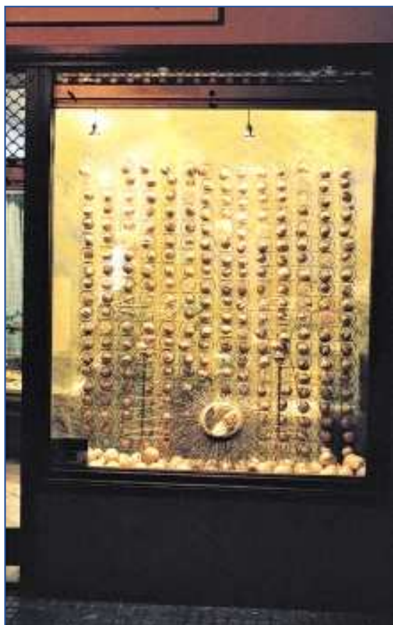
Labegoxo, primer premio en Alimentación.