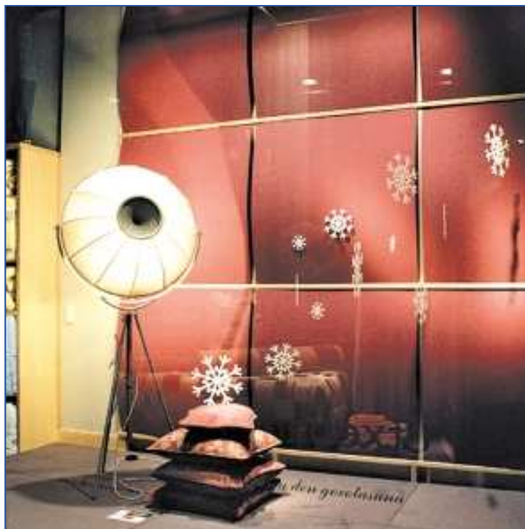
Etxebarru, primer premio en Equipamiento del Hogar.

En Equipamiento del Hogar, "Cerámicas Callejo", de Donostia, obtuvo el segundo premio, mientras que el tercero correspondió a "Kanela", de Bergara.