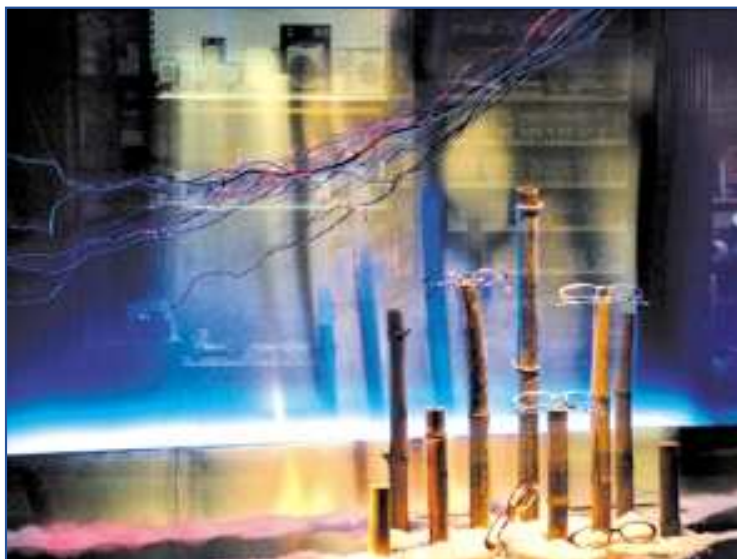
Óptica Harotz, primer premio en Varios.

La edición del Concurso de Escaparates 2002 ha incluido una categoría para premiar al mejor escaparate virtual de una empresa guipuzcoana en Internet. En esta modalidad, que certifica la pujanza de la presencia de los comercios en la red y el auge progresivo de la utilización de Internet, los tres primeros premios fueron a parar, respectivamente, a "Akelarre" ( www.akelarre.net ), "Tome Moda" ( www.tomemoda.com ) y "Frutas Dioni S.L." ( www.lahuertadelpais.es ). Los inscritos en esta categoría ascendieron a 32, casi el doble que el año anterior.